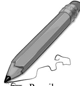
চিত্র : Pencil

উত্তর No, it is not a pencil, but it is a pencil. নো, ইট্ ইয়্ নট্ আ পেন্, বাট্ ইট্ ইয়্ আ পেন্সিল্। না, এটি নয় একটি কলম, কিন্তু এটি হয় একটি পেন্সিল।