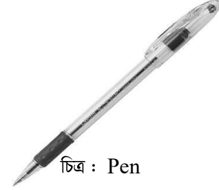
চিত্র : Pen

৩. প্রশ্ন IS THIS A PENCIL ? ইয়্ দিস্ আ পেন্ ? এটি কি একটি কলম