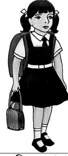
চিত্র : girl

উত্তরের সাবলীল বাংলা না, সে বালক নয়, বরং সে একটি বালিকা।