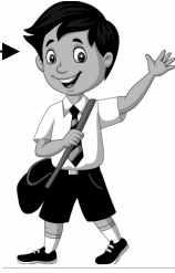
চিত্র : boy

উত্তরের সাবলীল বাংলা না, সে বালিকা নয়, সে একটি বালক।