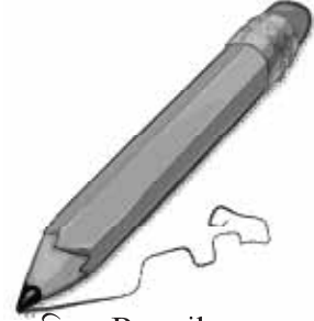
চিত্র : Pencil