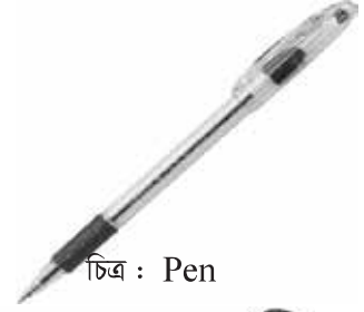
চিত্র : Pen